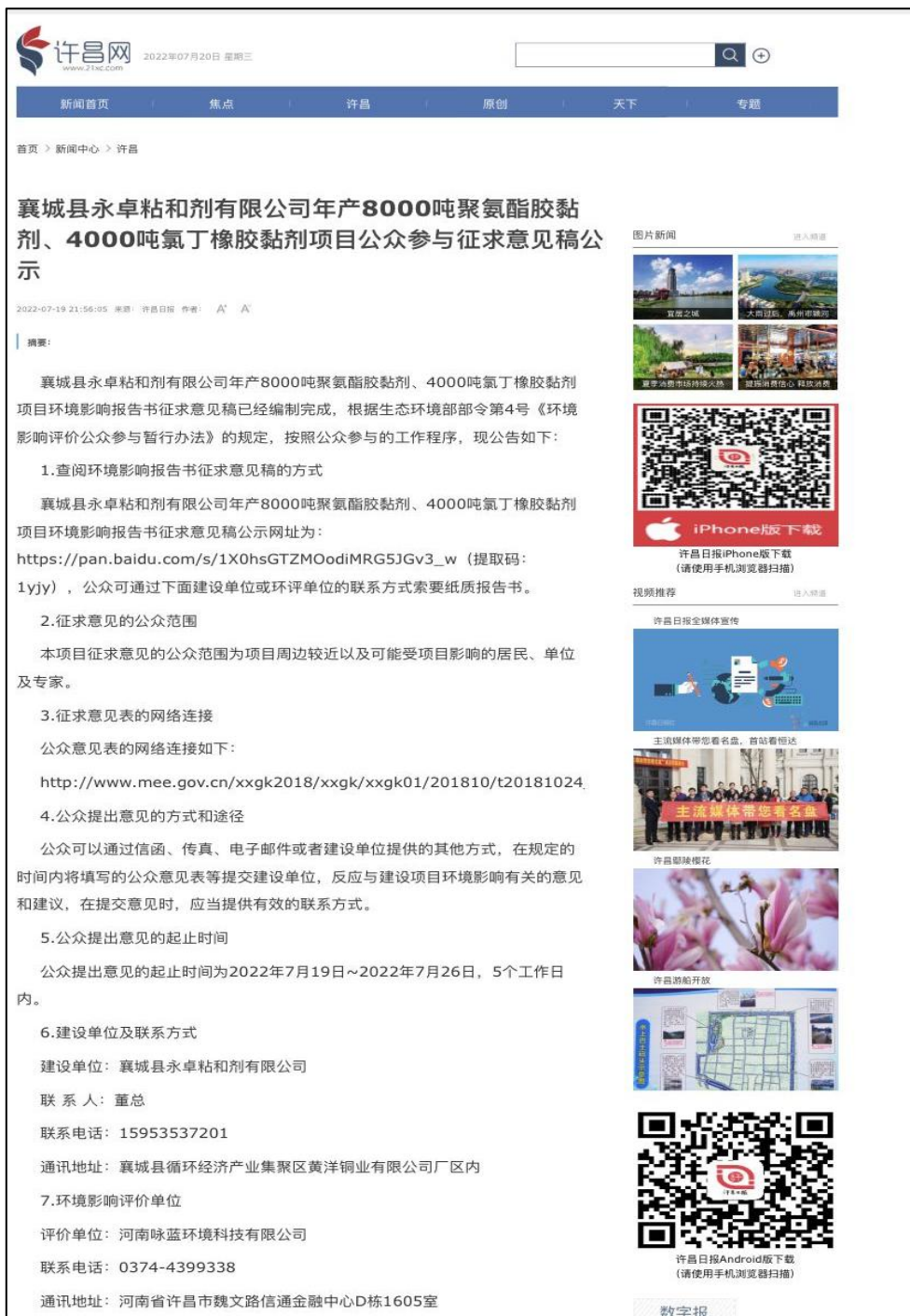
图1 项目网络公示截图