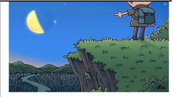
“月掩火星” 现夜空 新华社发 徐骏 作

声明 ● 盛依女, 出生时间2016年5月12日8时22分)的出生医学证明(编号:Q410709665)遗失, 现声明作废。 ● 陈非非的A2驾驶证(证号:411081198408057978)丢失, 现登报声明作废。