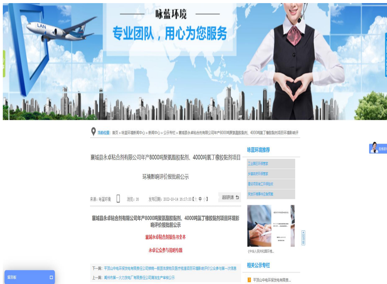
图 6 项目报批前网络公示截图

本项目报批前公示选用的网络平台为河南咏蓝环境科技有限公司官方网站。公示时间为 2022 年 10 月 14 日。公示链接为 http://www.xuchangeia.com/Article/xczyzzhjyx.html 。报批前网络公示截图见图 6。