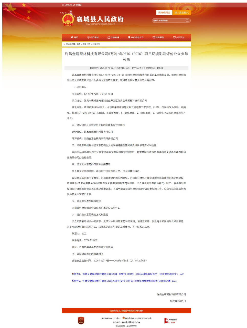
图 3-1 征求意见稿网络公示