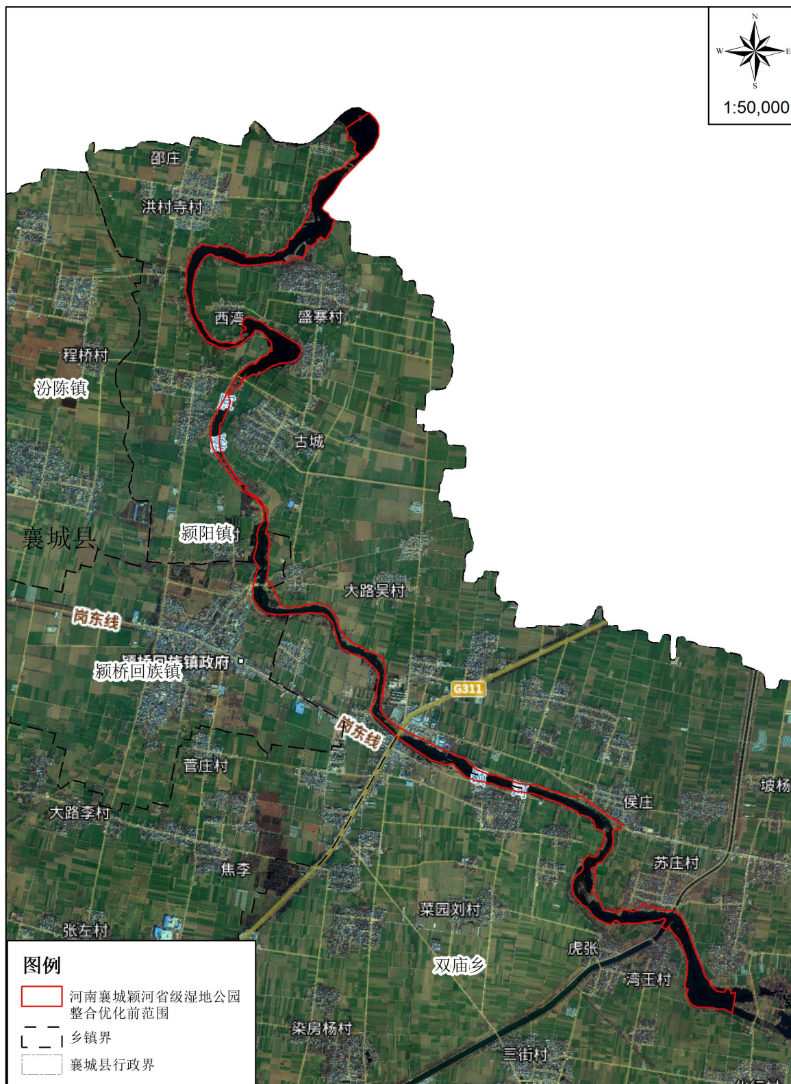
图1 河南襄城颍河省级湿地公园整合优化前范围图