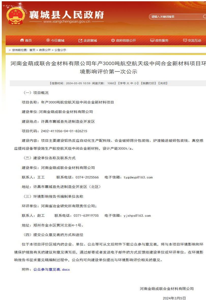
图 2-1 第一次网络公示

项目第一次公示平台采用襄城县人民政府官网，该网站面向所有公众开放。因此本项目使用襄城县人民政府官网进行公示，符合《环境影响评价公众参与办法》（部令第04号，2018）中“在所在地相关政府网站上公开”的要求。本网站查询方便快捷可以满足本次网络公示的需求，网址为（ http://www.xiangchengxian.gov.cn/zwgk/010001/20240305/d06e0ee6-0552-4ec4-a8d3-a28555727d11.html ）。本次公开时间为2024年3月5日。网络公示截图见图2-1。