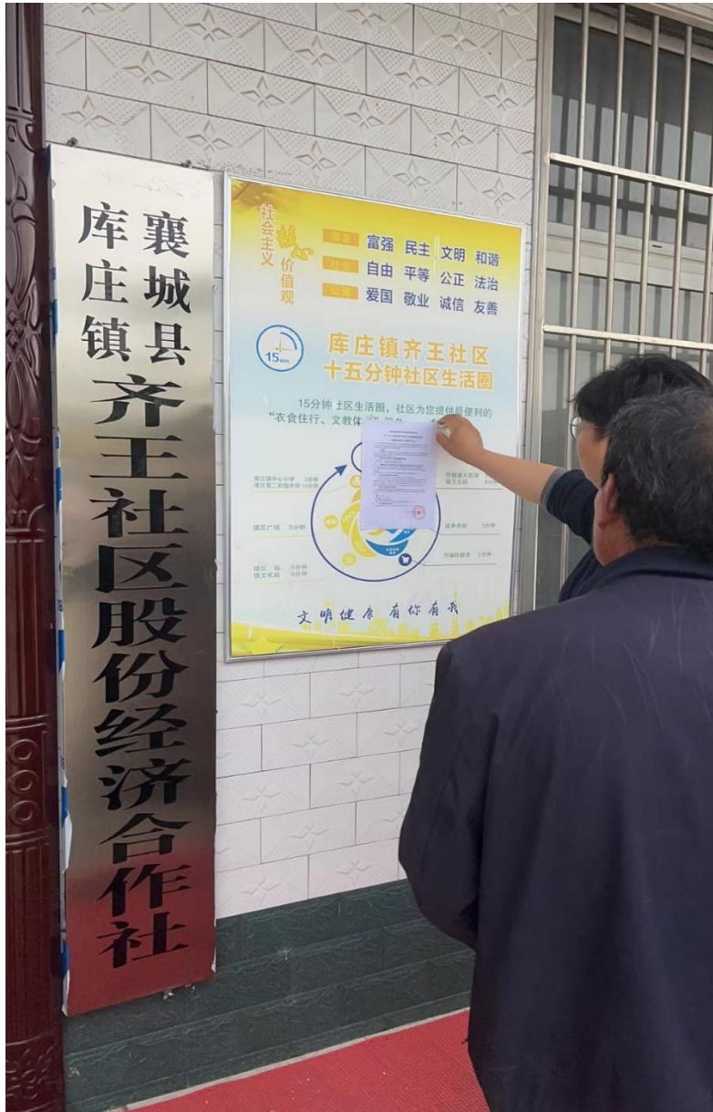
图 3-3 征求意见张贴公示