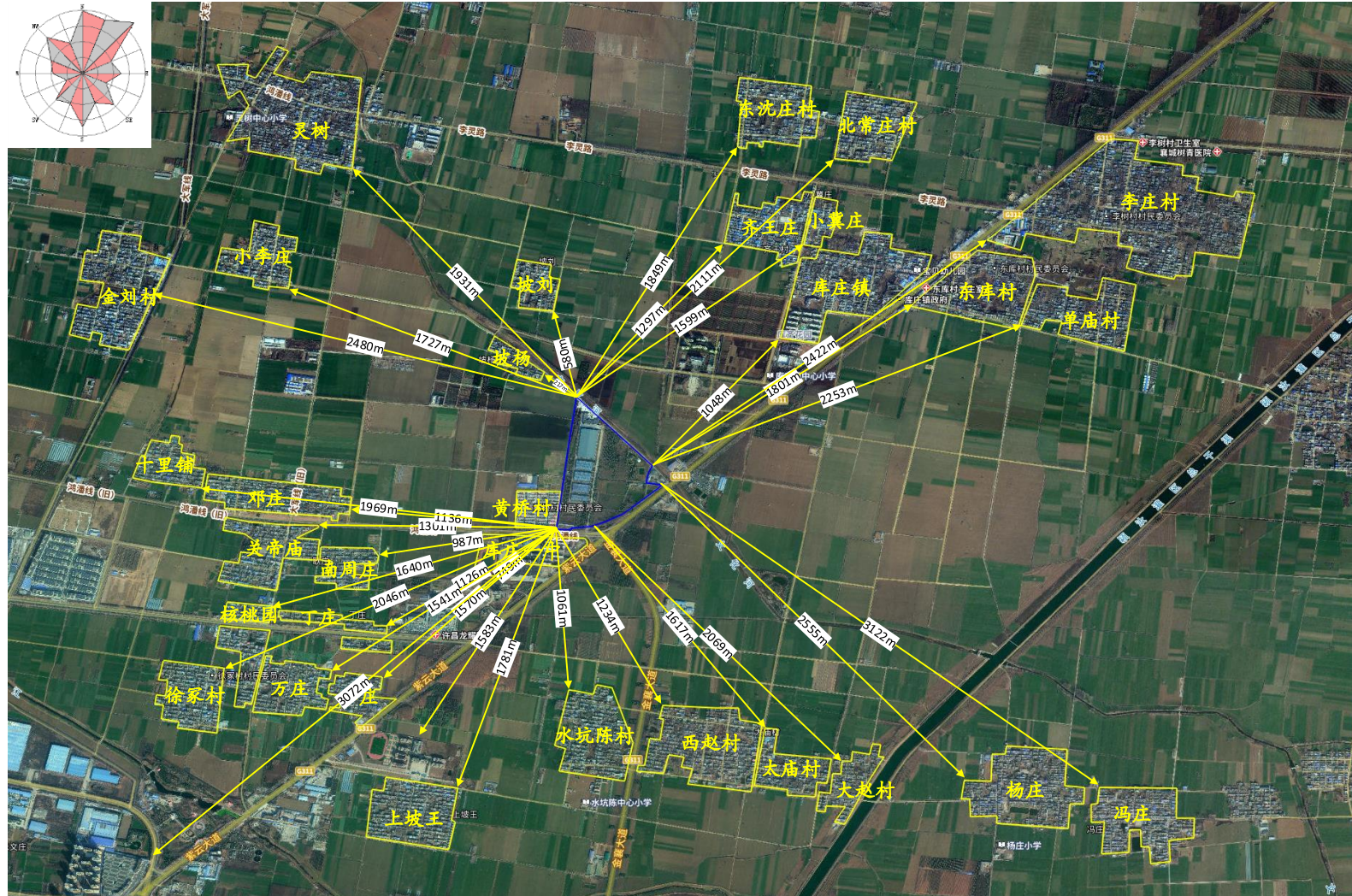
图 1-1 周边敏感点示意图